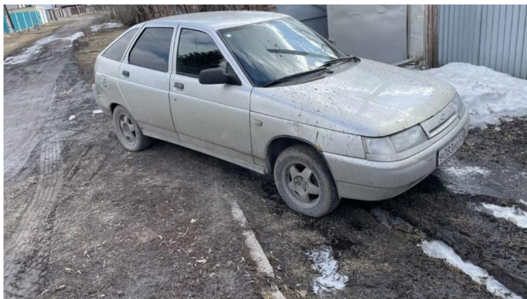
Фото автомобиля и документы:

Итого, рыночная цена автомобиля лот №1 автомобиль, Год выпуска: 2005 – 136 800 рублей